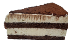
🚫 ★ 義式經典提拉米蘇