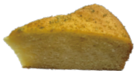
👑 法式檸檬蛋糕 550g