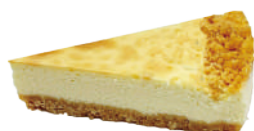
👑 紐西蘭濃郁重乳酪