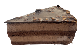
★ 金莎可可慕斯蛋糕