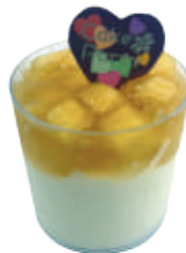
👑🚫 蘋果生乳水晶杯 25入/盒 (40g)