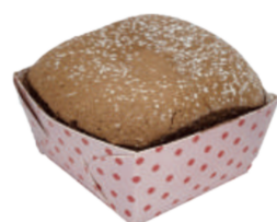
★ 巧克力生乳北海道 60入/盒 (33g)