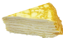
👑 法式生乳千層蛋糕