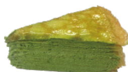
靜岡抹茶千層蛋糕