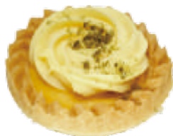
👑 🚫 檸檬玫瑰塔