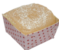
★ 生乳北海道 60入/盒 (30g)