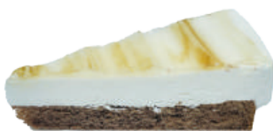
🚫★ 卡布奇諾咖啡蛋糕