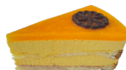
★ 芒果百香慕斯蛋糕