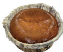
巴斯克乳酪蛋糕(3吋)