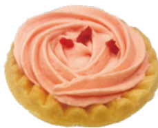
👑 🚫 草莓玫瑰塔