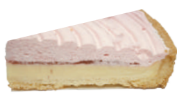
🚫 英式草莓派 600g