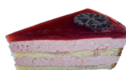
★ 草莓之戀慕斯蛋糕