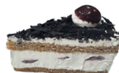
👑 🚫 ★ 黑櫻桃黑森林蛋糕