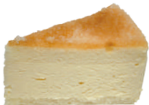
👑★ 焦糖起司蛋糕 550g