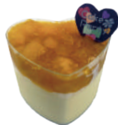
🚫 芒果生乳水晶杯 20入/盒 (45g)