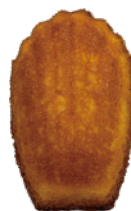
法式瑪德蓮 36入/盒 (20g)