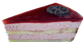
★ 草莓之戀慕斯蛋糕 600g