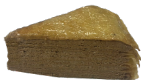
👑 厚奶茶千層蛋糕 550g