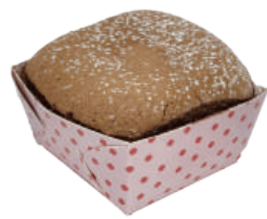
★ 巧克力生乳北海道 60入/盒 (33g)