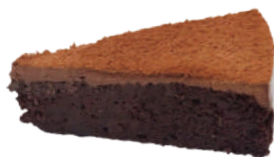
👑 生巧克力蛋糕 600g