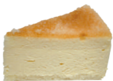
👑 ★ 焦糖起司蛋糕 550g