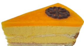
★ 芒果百香慕斯蛋糕 650g