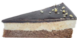
👑 ★ 德式巧可蛋糕 370g