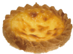
布蕾塔 60入/盒 (25g)