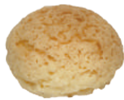
菠蘿泡芙 60入/盒 (22g)