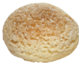
👑 卡士達泡芙 60入/盒 (25g)