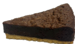
👑 美式古典蛋糕 450g