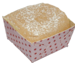
★ 生乳北海道 60入/盒 (30g)