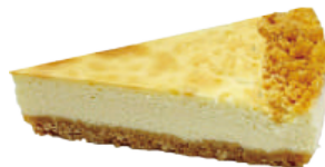
👑 紐西蘭濃郁重乳酪 700g