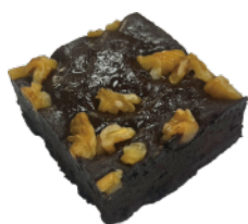
核桃布朗尼 9入/盒 (90g)