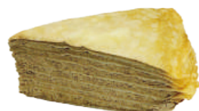
日本焙茶千層蛋糕 550g