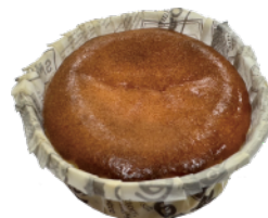
巴斯克乳酪蛋糕 (3吋) 9入/盒 (60g)