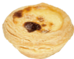
葡式蛋塔 70入/盒 (28g)