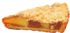
👑 英式手工蘋果派 750g