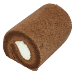
巧克力捲 98入/盒 (25g)