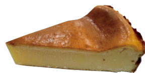
👑 巴斯克乳酪蛋糕 750g