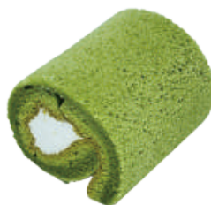
抹茶捲 98入/盒 (25g)