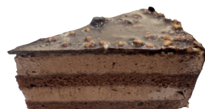
★ 金莎可可慕斯蛋糕 650g