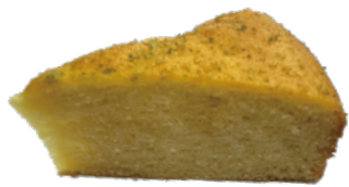
👑 法式檸檬蛋糕 550g