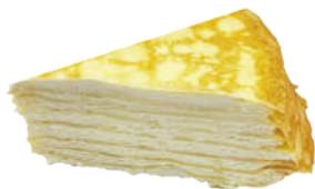
👑 法式生乳千層蛋糕 550g