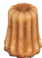
可麗露 70入/盒 (30g) 素宅