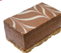
厚奶茶起司磚 3x5 40入/盒 (25g) (素) (宅)