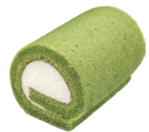
抹茶捲 98入/盒 (20g) 葷 宅