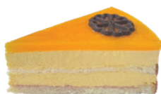
芒果百香慕斯蛋糕 650g 葷 宅