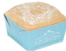
生乳北海道 60入/盒 (30g) 葷 宅