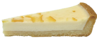
香橙派 600g 葷 宅