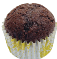
巧可磅蛋糕 96入/盒 (18g) 素宅