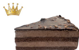
金莎巧可慕斯蛋糕 650g 葷 宅