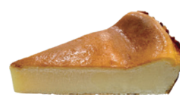
巴斯克乳酪蛋糕 750g 素 宅