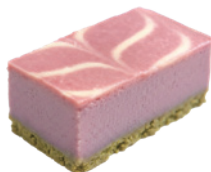
草莓起司磚 3x5 40入/盒 (25g) (素) (宅)