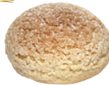
卡士達泡芙 60入/盒 (25g) 素 宅