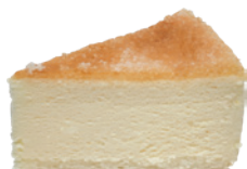
焦糖起司蛋糕 550g (葷) (宅)