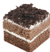
黑森林蛋糕 4x4 70入/盒 (15g) (葷) (宅)