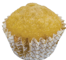
日式橘子磅蛋糕 96入/盒 (18g) 素宅