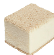
冰心乳酪 4x5 42入/盒 (35g) (葷) (宅)