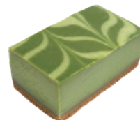
抹茶起司磚 3x5 40入/盒 (25g) (素) (宅)