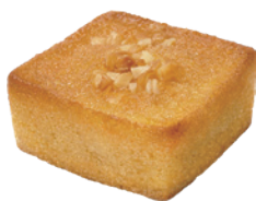
費南雪 4.5x4.5 144入/盒 (15g) 素宅