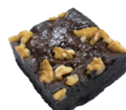
核桃布朗尼 9入/盒 (90g) 素 宅