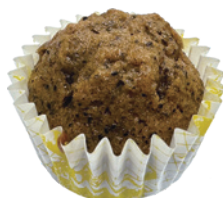
摩卡咖啡磅蛋糕 96入/盒 (18g) 素宅