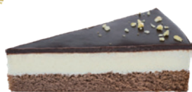
德式巧可蛋糕 370g (葷) (宅)