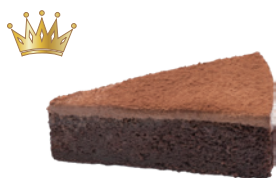
74%生巧克力蛋糕 600g 素 宅