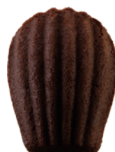
巧可瑪德蓮 150入/盒 (10g) 素宅