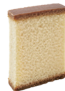
蜂蜜風味蛋糕 2x5 100入/盒 (18g) (素) (宅)