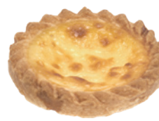
布蕾塔 60入/盒 (25g) 素 宅