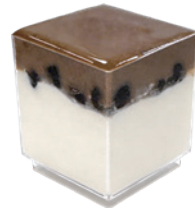
珍奶生乳水晶杯 25入/盒 (35g) 葷 宅