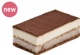
馬斯卡邦提拉米蘇 4x7.5 30入/盒 (40g) 素 宅