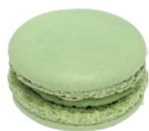
抹茶馬卡龍 90入/盒 (10g) 素宅