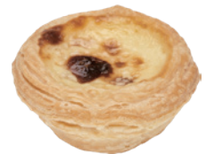
葡式蛋塔 70入/盒 (28g) 素 宅