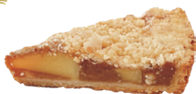
英式手工蘋果派 750g (素) (宅)