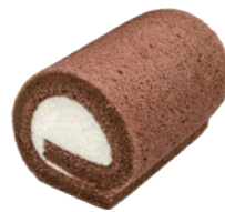
巧克力捲 98入/盒 (20g) 葷 宅