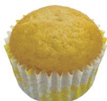
香草磅蛋糕 96入/盒 (18g) 素宅