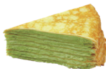
靜岡抹茶千層蛋糕 550g 素 宅