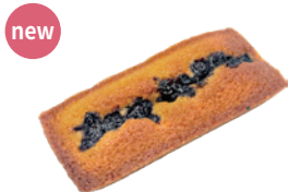
藍莓黑醋栗金磚費南雪 4.5x9 72入/盒 (28g) 素 宅