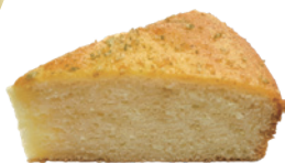
法式檸檬蛋糕 550g (素) (宅)