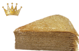
厚奶茶千層蛋糕 550g 素 宅