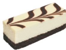
大理石乳酪條 2.5x7 55入/盒 (30g) (素) (宅)