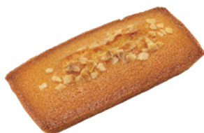
原味金磚費南雪 4.5x9 72入/盒 (25g) 素宅