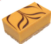
芒果起司磚 3x5 40入/盒 (25g) (素) (宅)