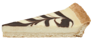
大理石派 500g 素 宅