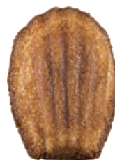
檸檬瑪德蓮 150入/盒 (10g) 素宅