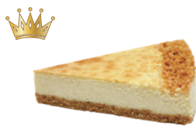
紐西蘭濃郁重乳酪 700g 素 宅