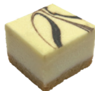
經典起司磚 3x3 49入/盒 (20g) (素) (宅)