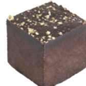
堅果布朗尼 3x3 108入/盒 (18g) (素) (宅)