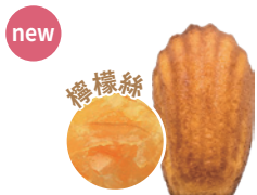
法式檸檬瑪德蓮 60入/盒 (20g) 素 宅