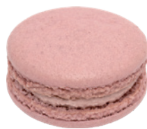
草莓馬卡龍 90入/盒 (10g) 素宅