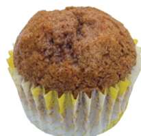
厚奶茶磅蛋糕 96入/盒 (18g) 素宅