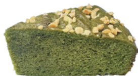
日式抹茶蛋糕 550g (素) (宅)