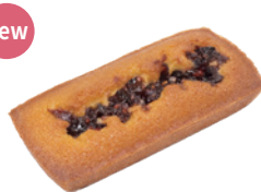
覆盆子蔓越莓金磚費南雪 4.5x9 72入/盒 (28g) 素 宅