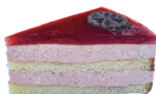
草莓之戀慕斯蛋糕 600g 葷 宅