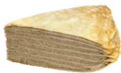
日本焙茶千層蛋糕 550g 素 宅