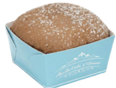
巧克力生乳北海道 60入/盒 (33g) 葷 宅