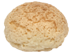
菠蘿泡芙 60入/盒 (22g) 素 宅