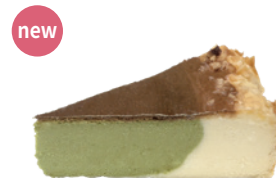
開心果巴斯克乳酪蛋糕 750g 素 宅